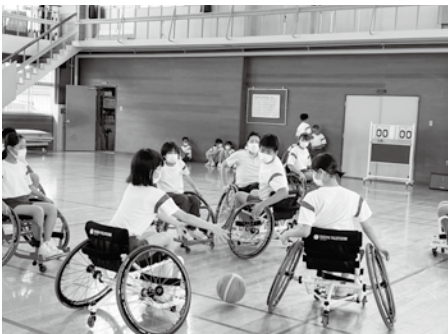
車いすバスケット