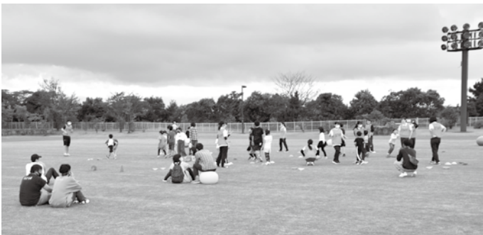
陸上競技場・テニスコート