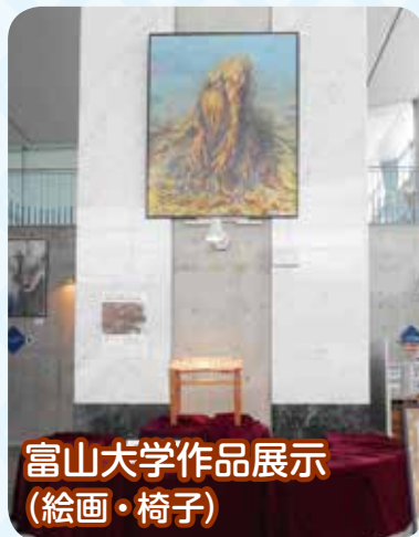
富山大学作品展示 (絵画・椅子)