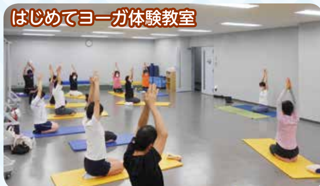
はじめてヨガ体験教室