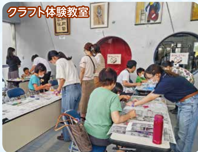
クラフト体験教室