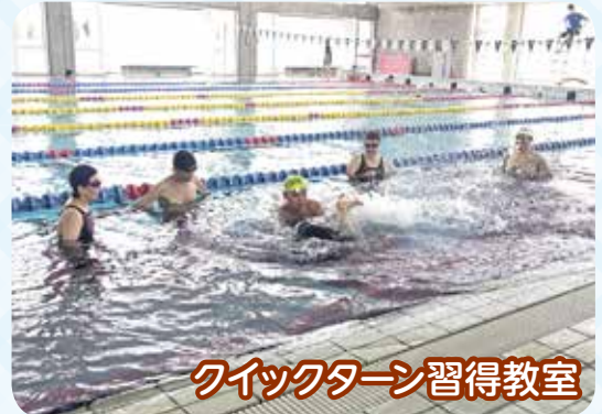
クイックターン習得教室