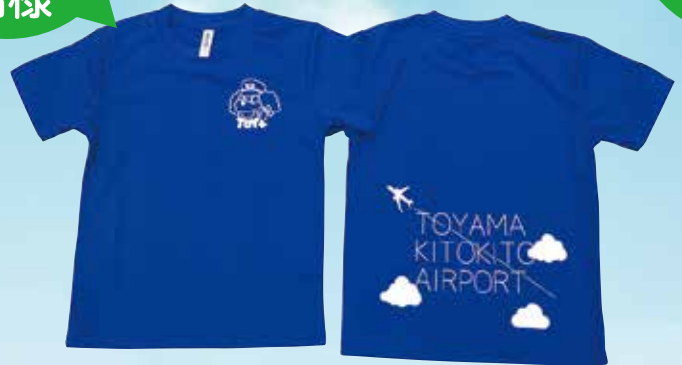
※Tシャツのサイズは140cm前後、選べません。