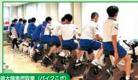
最大酸素摂取量 (バイクこぎ)