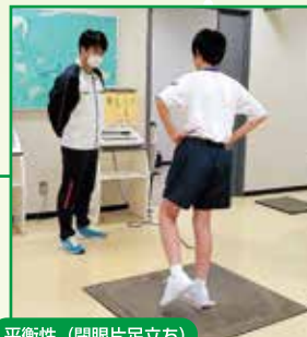
平衡性 (閉眼片足立ち)