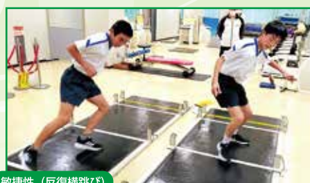
敏捷性 (反復横跳び)