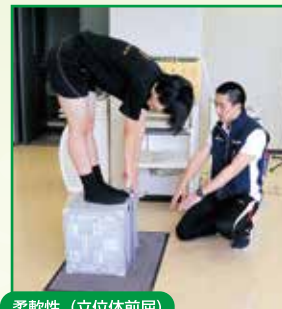
柔軟性 (立位体前屈)