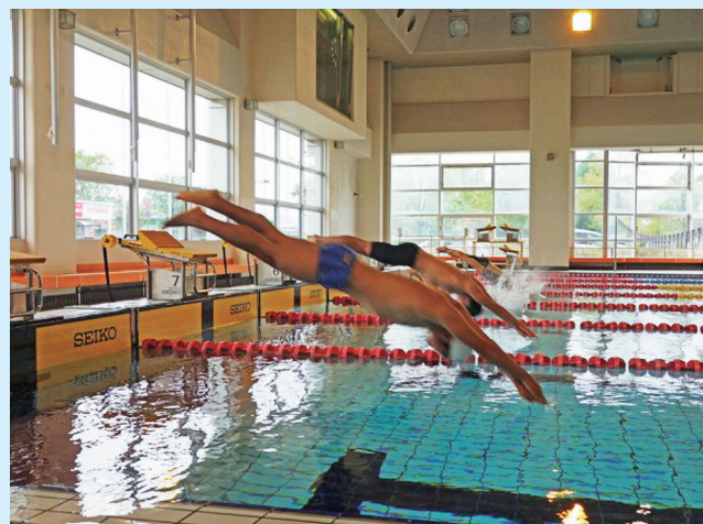
水泳フリー記録会