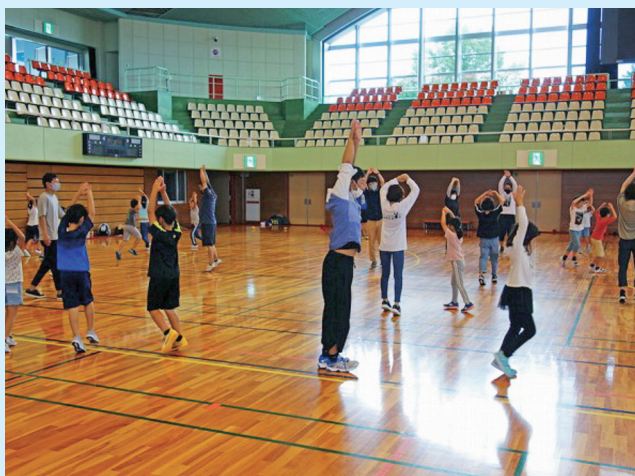
アクティブキッズプロジェクト