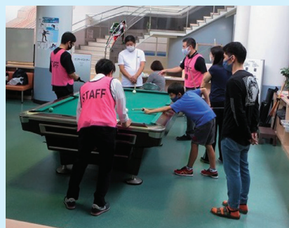
ビリヤード体験コーナー