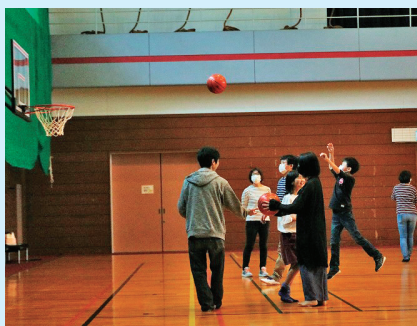
バスケットボール体験コーナー