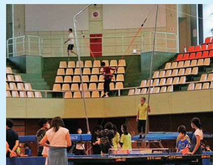
トランポリン体験コーナー