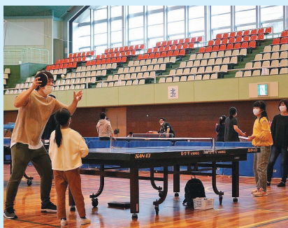
卓球体験コーナー