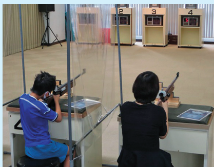
ビームライフル体験コーナー